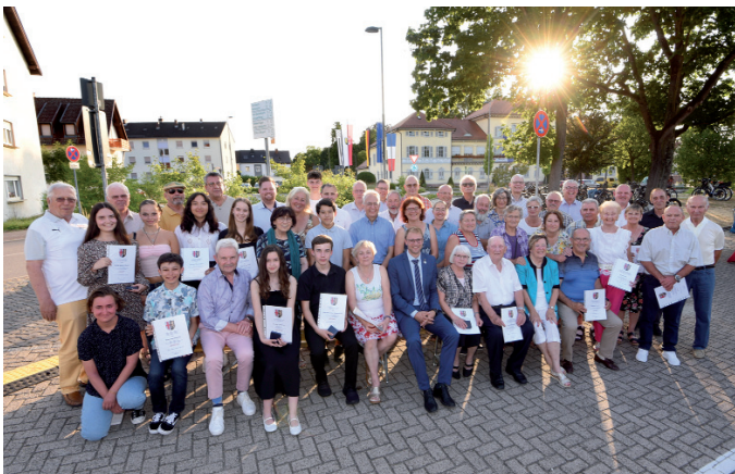
Ehrungsabend für „die Besten der Gemeinde“: Erfolgreiche Sportler und Kulturschaffende sowie Ehrenamtliche wurden ausgezeichnet