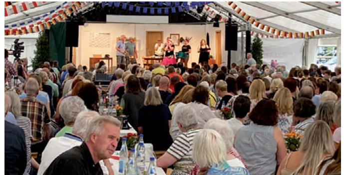
Mit dem Theaterstück „Für immer Disco“ sorgte die Laienschauspielertruppe des Gesangvereins Neckarhausen für Lachsalven