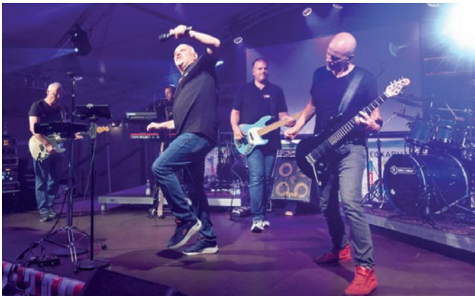
Die T-Band „rockte“ am ersten Jubiläumsabend das vollbesetzte Festzelt