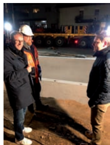
Der Bau der neuen Druckerhöhungsanlage in der Platanenstraße in Neu-Edingen machte zügige Fortschritte. Im Februar wurden wichtige Bauelemente angeliefert. Bürgermeister Florian König, der zugleich Vorsitzender des Wasserversorgungsverbandes ist, verschaffte sich ein Bild über den Stand der Arbeiten vor Ort.