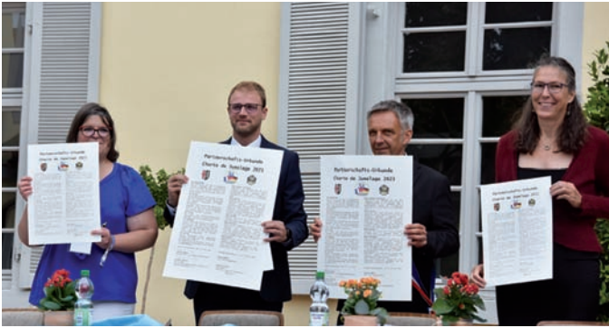
Unterzeichnung der Partnerschaftsurkunden – Es lebe die Partnerschaft