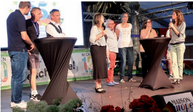
Beim Quizspiel des Europäischen Abends war auch Allgemeinwissen gefragt