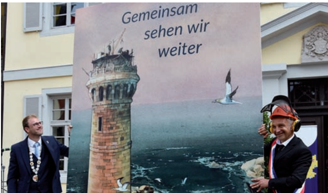
Das Bildgeschenk „Gemeinsam sehen wir weiter“ aus Plouguerneau darf auch als künftiges Leitbild für die Partnerschaft verstanden werden