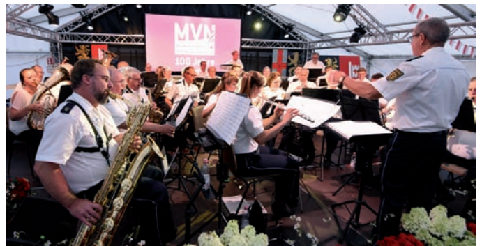
Die Musikvereinigung feierte ihren 100. Geburtstag: Das Polizeiorchester Mannheim (im Bild) und die SRH-Big-Band spielten dabei groß auf